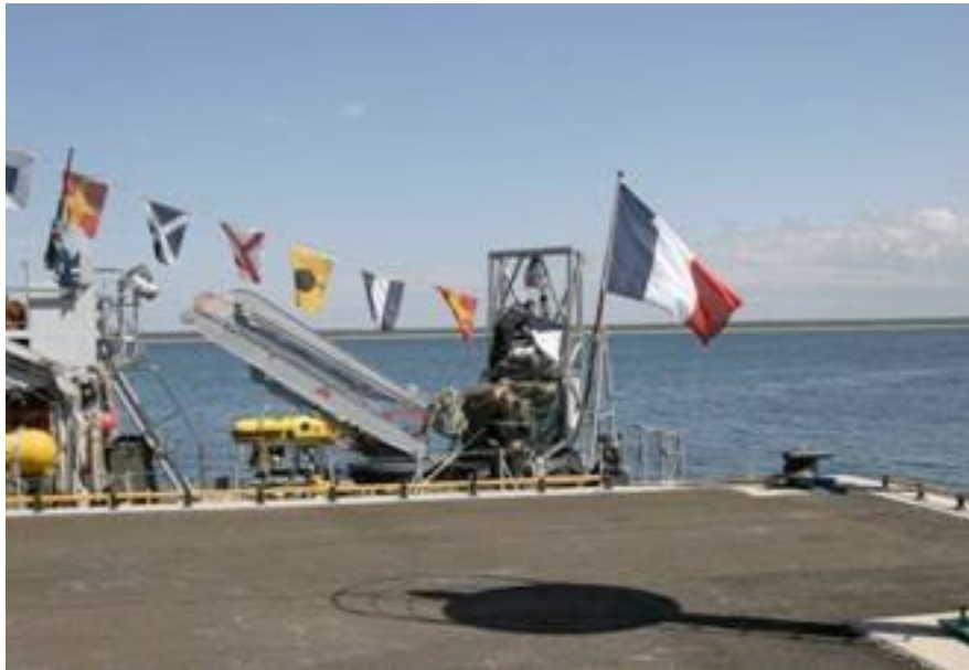
Prantsuse sõjalaev Saaremaa uues süvasadamas Võidupühal, 2006.