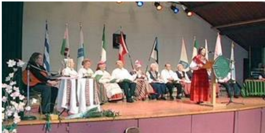
Laval istuvad maakondlike organisatsioonide esindajad ootamas momenti oma osa ettekandmiseks.

http://www.eesti.ca/main.php?op=article&articleid=15786&PHPSESSID=8bed080da42dc09c59805f101b49b0bf