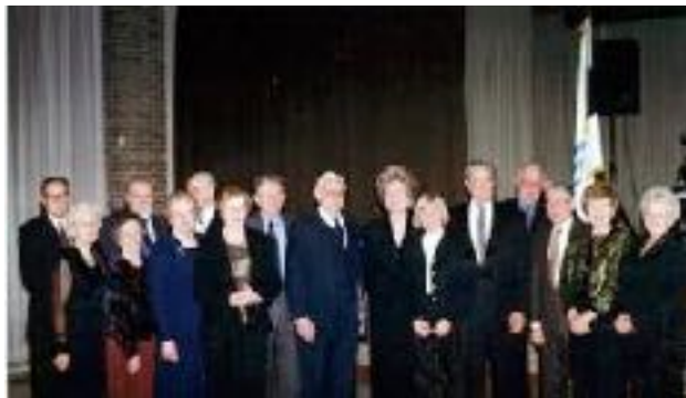
Grupp rõõmsaid peolisi SÜT traditsioonilisel küünlapäevapeol Toronto Läti kultuurikeskuses veebruaris 2002, kes osalesid ka 47 aastat tagasi toimunud Toronto saarlaste esimesel küünlapäevapeol 4. veebruaril, 1955 Poola Majas.