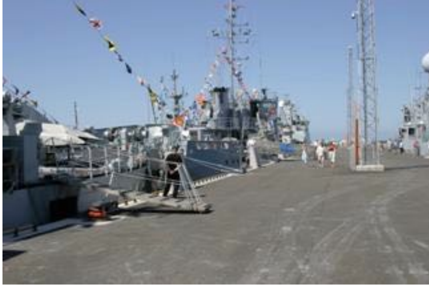
NATO sõjalaevu Saaremaa uues süvasadamas Võidupühal, 2006.